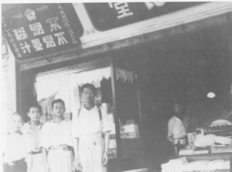
相片在日據時代台南地區知名的文具商いろは堂前所攝。