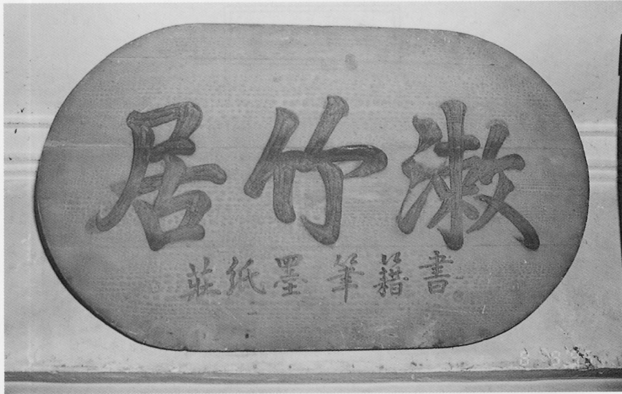
歷史悠久的漱竹居招牌。