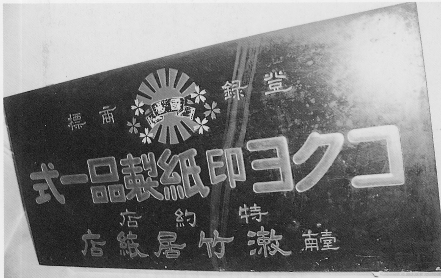
ヒワヨ印紙製品一式特約店招牌