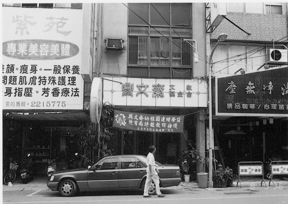
台南興文齋文教基金會