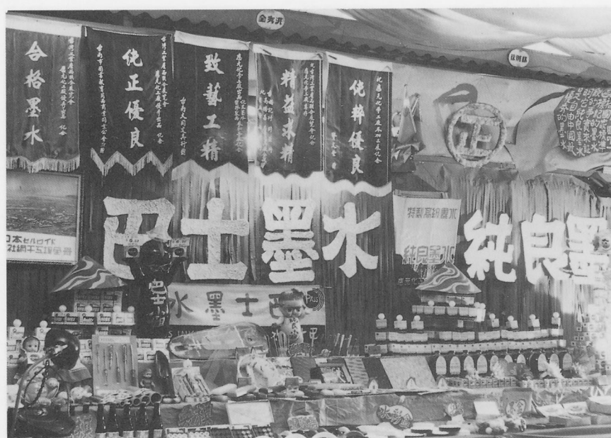
應元化學公司所生產的巴士墨水，純良墨水的展覽會攤位。