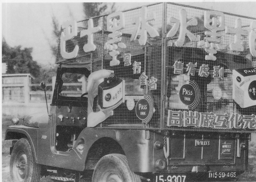
巴士墨水的廣告宣傳車。