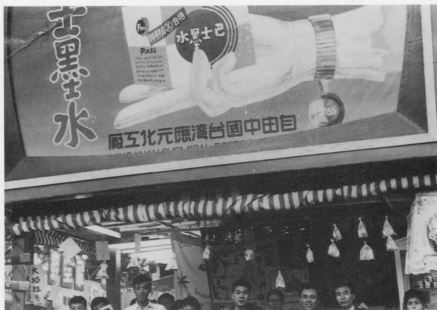
民國四十年在台南舉行的文具展覽會，圖為應元化學公司所生產的巴士墨水廣告。