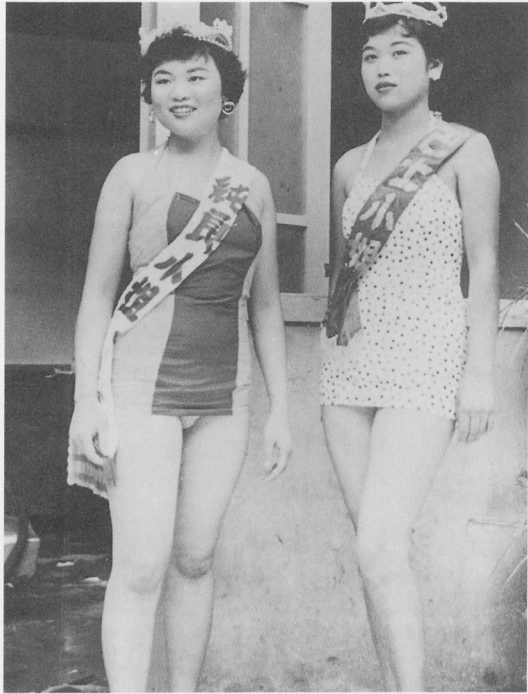
過去文具業常以模特兒為活廣告，宣傳產品。圖為民國四十五年純良墨水及巴士墨水參加商展時所聘請的「純良小姐」及「巴士小姐」相片。